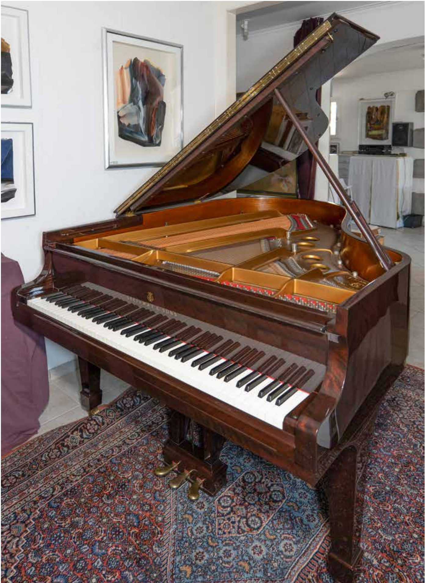
Steinway & Sons Modèle O-180

Piano à queue construit à Hambourg, dans un état exceptionnel, préparé pour un usage privé à long terme.